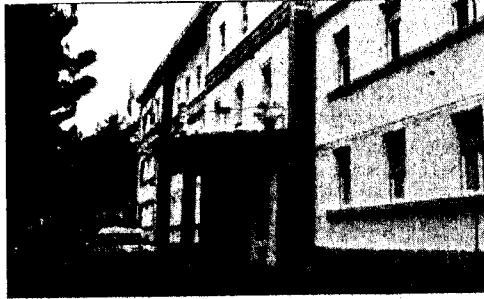
L'ospedale di Agnone