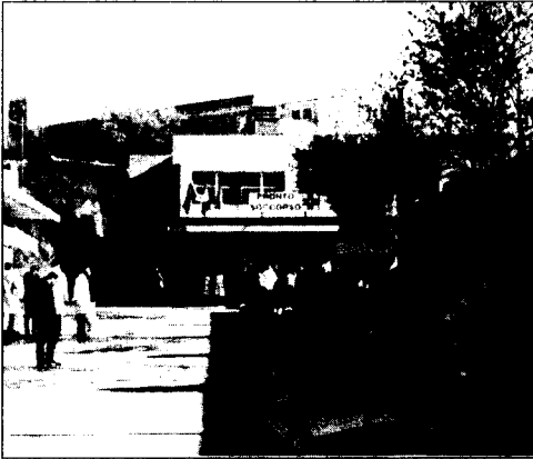
Il Pronto Soccorso del Veneziante

Ospedale, al via il progetto degli ambulatori per i "codici bianchi". Saranno attivati a breve dall'Asrem nei nosocomi di Isernia e Venafro. Finalmente possono tirare un sospiro di sollievo sia i malati che i medici del pronto soccorso isernino, dove nelle scorse settimane più volte è stato necessario il blocco dei ricoveri a causa del congestionamento del reparto. E proprio in seguito ai disagi che si sono venuti a creare negli ultimi tempi, l'Asrem ha deciso di avviare in maniera sperimentale questo nuovo servizio che è finalizzato a garantire una risposta sanitaria ai cittadini che non presentano patologie a carattere di emergenza o di urgenza - cioè quelli che si definiscono normalmente codici bianchi, appunto - e a migliorare le condizioni di lavoro