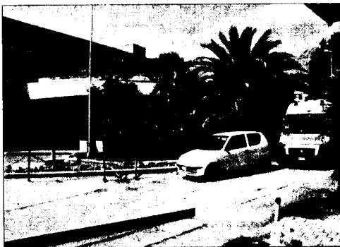
Una utilitaria in sosta selvaggia sbarrò il passo all'ambulanza

L'incoscienza degli automobilisti continua a causare gravi problemi alle ambulanze