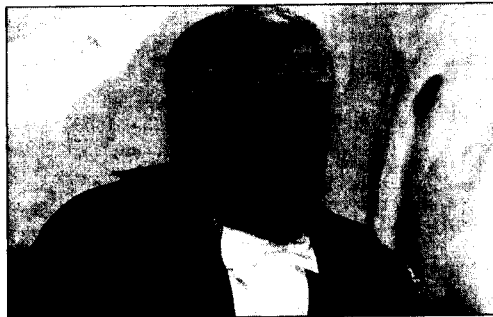
L'ex presidente della Corte d'Appello, Nicola Passarelli

Non c'è ancora una delibera del presidente. Valuterò non appena mi saranno indicate le deleghe". La prudenza della più alta carica della giustizia molisana apre la pista a un dubbio: presidente, non sarà che lei ha appreso delle intenzioni del presidente della regione solo dai media? No. Su questo fatti certi esistono, eccome. "Ho dato la mia disponibilità - assicura l'ex giudice - nulla di più. Parlerò però quando avremo qualcosa di più concreto su cui ragionare". Per il momento persistono solo i retroscena. È un incontro a Palazzo Santoro c'è già stato. Proprio il giorno precedente la diffusione della notizia: Iorio che sceglie l'ex presidente della Corte d'Appello come nuovo assessore regionale. Il 3 agosto Primo Piano pubblicava la notizia. A poco a poco