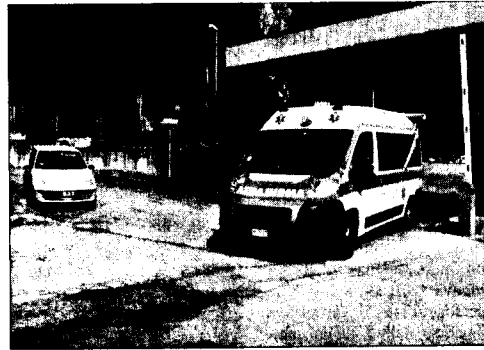
L'ambulanza è costretta ad uscire in retromarcia

VENAFRO. E' successo ancora e nuovamente tutti se ne sono lavati le mani. Ieri mattina una donna, evidentemente di scarso senso civico, aveva parcheggiato la propria vettura all'interno del recinto dell'ospedale, proprio in corrispondenza della barra del cancello d'uscita. In tal modo ha reso oltremodo complicata la manovra del conducente dell'ambulanza che per guadagnare l'esterno dell'ospedale si è visto costretto a procedere in retromarcia. Anche in questo