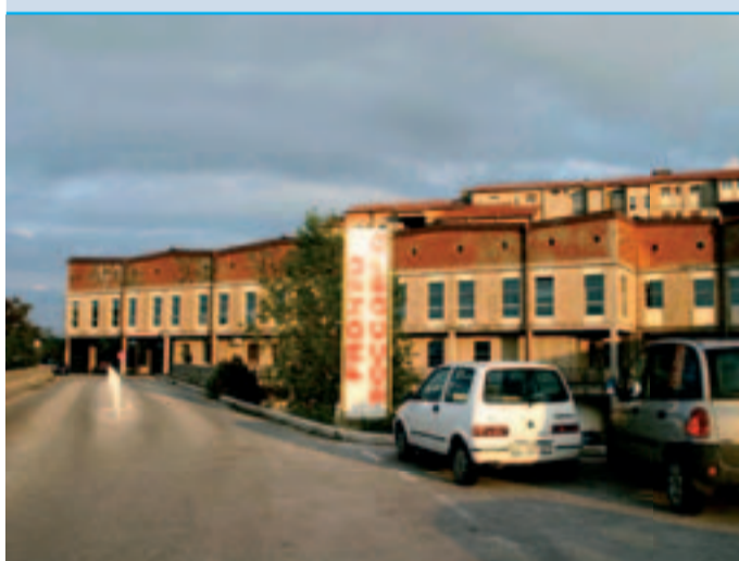
Malasania al Cardarelli, una 23enne ha rischiato di morire

Una 23enne di Riccia rischia di morire, il racconto della mamma