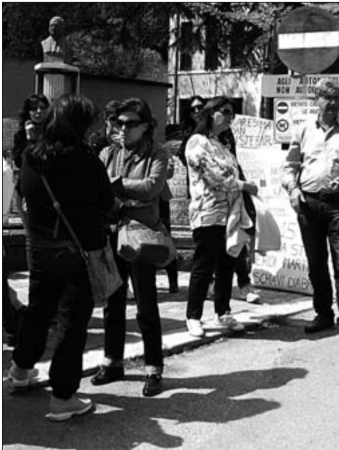
La manifestazione dei dipendenti San Stefar