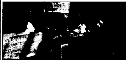
I lavoratori della San Stefar in protesta