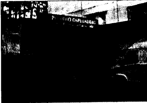
L'ingresso del Caracciolo