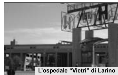
L'ospedale "Vietri" di Larino

CAMPOBASSO. Sarà sottoscritto martedì 25 gennaio l'accordo tra la Regione Molise e l'ospedale "Bambin Gesù" di Roma che darà il via alla nascita del polo pediatrico all'interno dell'ospedale "Vietri" di Larino. Il centro dovrà rappresentare un punto nevralgico anche per le confinanti regioni Abruzzo e Puglia. Sarà allocato in un'ala del nosocomio frentano che, in questa maniera, non sarà privato della sua qualifica di ospedale. Il progetto rientra nell'ambito del piano di riorganizzazione ospedaliera come presentato a Roma ai ministeri dell'Economia e della Salute. La scelta fatta dai vertici dell'ospedale romano di preferire una struttura molisana, deriva dalla necessità di dilatare sul territorio la lunga lista di attesa che vede molti casi provenire proprio dalle tre regioni particolarmente interessate all'ubicazione di Larino. L'accordo ha già trovato piena rispondenza tra le parti e sarà stilato in settimana per essere, poi, firmato a Campobasso il prossimo 25 gennaio.