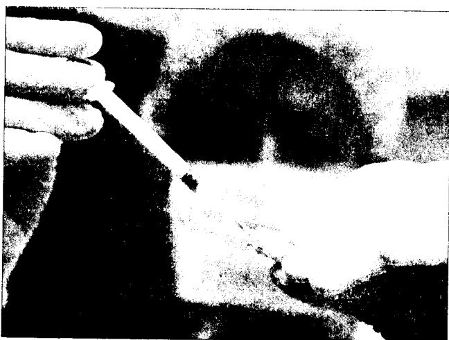
Del tutto ingiustificata la psicosi da influenza A

VENAFRO. Alimentata dalle notizie non proprio confortanti battute dalle agenzie di stampa nazionale, la psicosi da "febbre suina" si diffonde in tutta la regione. Non fa certo eccezione Venafro, dove negli ultimi giorni i sanitari del pronto soccorso hanno dovuto munirsi con una certa frequenza di guanti e mascherine. Nell'ultima settimana, infatti, è cresciuto il numero delle persone che bussano alle porte del "Santissimo Rosario" temendo di aver contratto il tanto temuto virus H1N1. Fortunatamente in massima parte si tratta di falsi allarmi, di sintomatologie legate all'avvento della brutta stagione. Non per niente i casi finora accertati in tutto il Molise non superano le cinquanta unità. A livello nazionale, invece, sono ben 250mila le persone che hanno contratto l'influenza A, un numero destinato a crescere progressivamente, fino a raggiungere il picco massimo attorno a Natale, quando, a parere degli esperti milioni di italiani saranno costretti a letto. Diciotto finora le vittime italiane di questo nuovo virus, quasi tutte decedute in conseguenza di gravi patologie pregresse. In ogni caso si tratta di una forma influenzale piuttosto blanda, basti considerare che nell'emisfero australe, dove l'inverno è già passato, l'indice di mortalità è stato dello 0,4 per mille contro lo 0,9