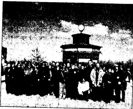
I dipendenti della Cooptur durante una protesta lo scorso inverno