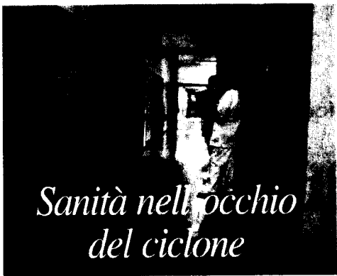
Sanità nell'occhio del ciclone