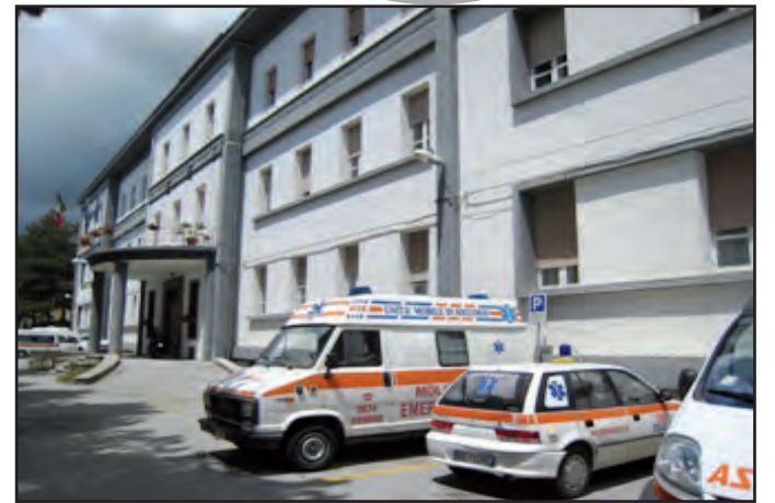
L'ospedale San Francesco Caracciolo di Agnone