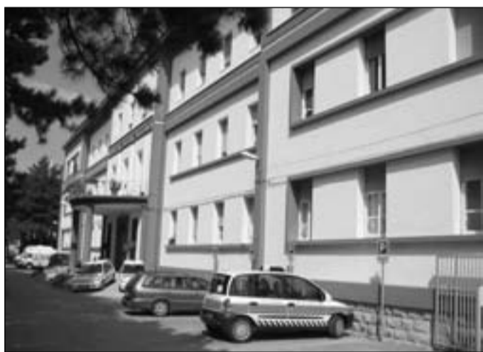
L'ospedale. In alto, la riunione del comitato Articolo 32

menti civici come Il Cittadino C'è, non c'è stata più nessuna manifestazione di solidarietà per una battaglia che in definitiva riguarda anche loro. Sofferenti e pazienti che riescono a raggiungere in pochi minuti l'ospedale di Agnone. Come è dimostrato proprio da alcune urgenze, traumi seri e ricoveri, registrati negli ultimi giorni e provenienti dai paesini del vicino Abruzzo.