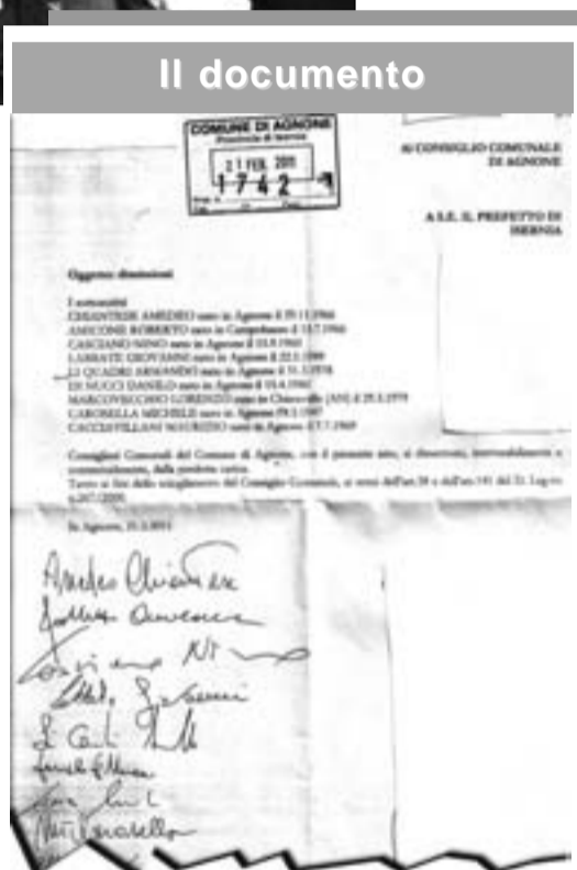
Una giornata frizzante quella di ieri, fin dalle prime ore del mattino. Dopo i tanti tentennamenti dell'altra sera si è cementata