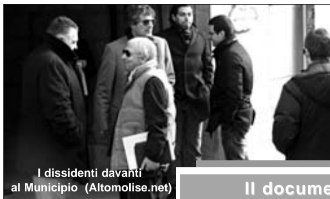
I dissidenti davanti al Municipio