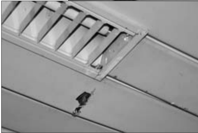
Decrepite e arrugginite le controsoffittature