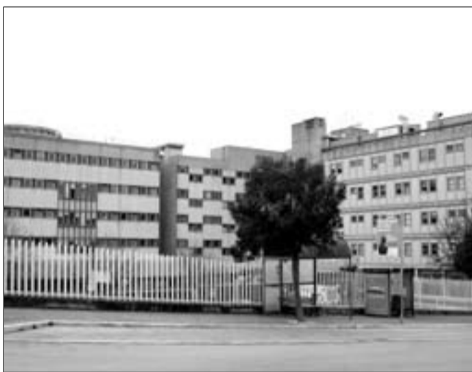
L'ospedale "F. Veneziale" di Isernia