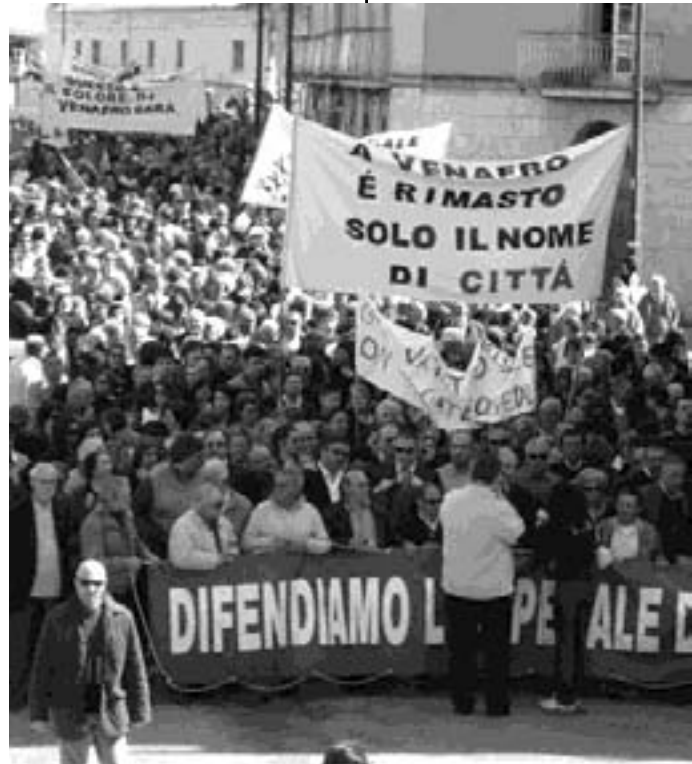
Ore 10,30, Venafro si ferma per il Santissimo Rosario

L'ultima volta (ad aprile 2009) scesero in piazza migliaia e migliaia di venafrani, sempre per la difesa dell'ospedale cittadino. Stamattina si spera che siano ancora di più. Sono state infatti avvertite tutte le scuole superiori della città. Le organizzazioni sindacali e di categoria tra cui la Coldiretti, che ha promesso una sfilata di iscritti attraverso grossi