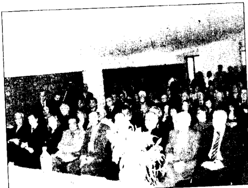
In tanti ieri al convegno. Sotto, i dipendenti del poliambulatorio

fosse bisogno alle prestazioni sanitarie di qualità in tempi rapidissimi. Servizio di 118, medicina di base, servizio veterinario e centro prelievi queste e tante altre le attività che attualmente medici e infermieri portano avanti giorno dopo giorno con grande passione. Una struttura unica in tutto il territorio limitrofo di Frosolone e che accoglie ogni giorno pazienti provenienti anche da paesi della Provincia di Campobasso. Ad aprire la cerimonia il Vescovo della Diocesi di Trivento monsignor Domenico Angelo Scotti: "Sono contento di essere qui oggi. La presenza di queste strutture sul nostro territorio non può che far bene alla nostra Regione. La cosa importante è che si deve tenere a mente e che oltre alle strutture ai malati occorrono anche sorrisi, cordialità e dedizione", così il vescovo termina la benedizione del Poliambulatorio, con parole semplici e chiare che ricordano quanto sia importante disporre di un personale altamente qualificato anche sotto il profilo umano.