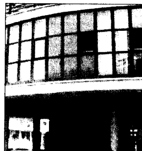
servizi offerti al territorio dalla San Stefar, ma le risorse, per qualche motivo, non vengono trasferite ai lavoratori.

I sindacati hanno chiesto alla Regione Molise di attivare un tavolo tecnico per affrontare la vertenza. L'Azienda sanitaria regionale ha confermato comunque il regolare pagamento dei