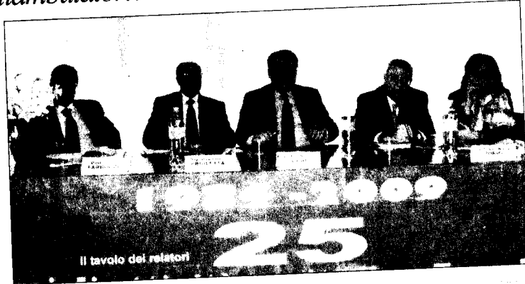
Il tavolo dei relatori

Alla benedizione presenti anche le associazioni del paese