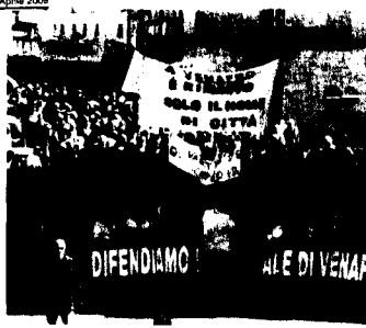
La grande mobilitazione di Venafro in piazza per difendere il suo ospedale

VENAFRO - Ancora più grande, massiccia ed imponente. Anche di quella del 24 gennaio. La manifestazione di ieri mattina, sempre a favore dell'ospedale SS Rosario di Venafro, è stata la più partecipata nella storia della città.