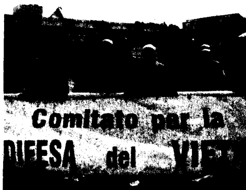
La manifestazione del 28 marzo scorso

La mancanza di assunzione di anestesisti e rianimatori starebbe dunque provocando disorientamento e malessere negli operatori sanitari che in questi ultimi tempi denunciano il blocco delle attività di reparti di altissimo livello "cui la suddetta delibera ha disposto un ri-