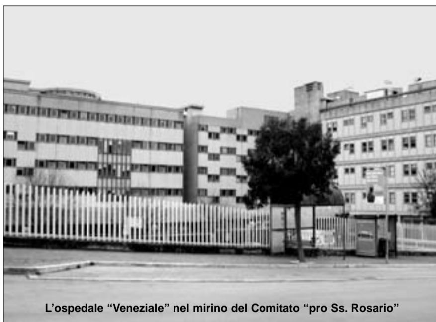
L’ospedale “Veneziale” nel mirino del Comitato “pro Ss. Rosario”