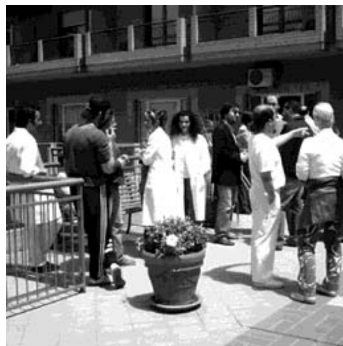
I dipendenti dell'Igea attendono il pagamento degli stipendi

Il personale della struttura è composto da circa quaranta unità