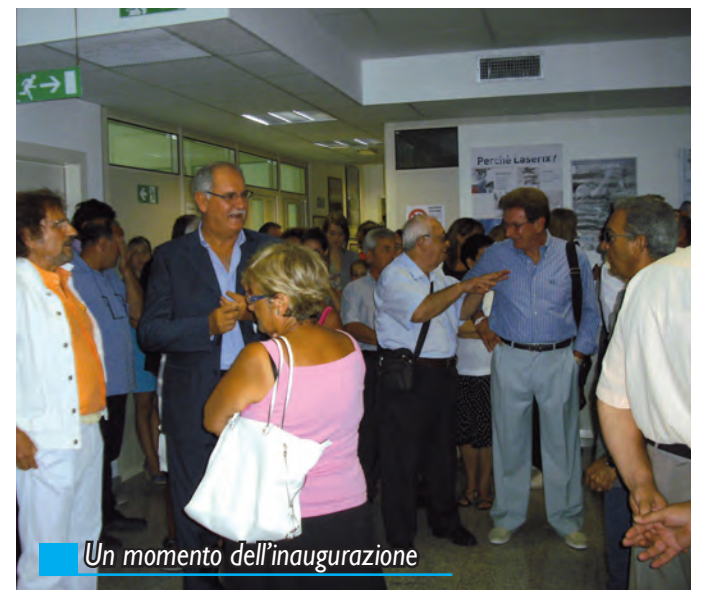
Un momento dell'inaugurazione