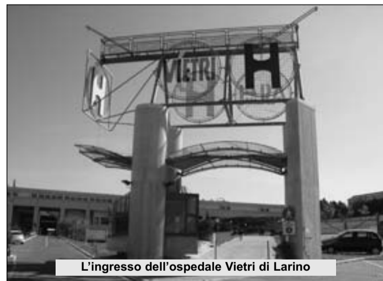
L'ingresso dell'ospedale Vietri di Larino