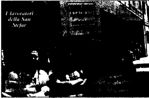
I lavoratori della San Stefar