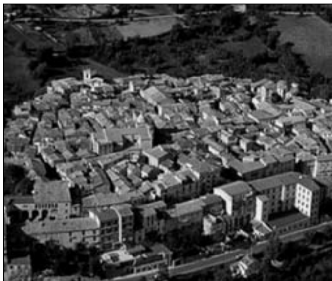
Una veduta di Frosolone

Il Poliambulatorio ha un largo bacino di utenza proveniente dai tanti centri limitrofi come Torella, Molise, Duronia, Macchiagodena e Civitanova del Sannio. In quest'ultimo periodo sono state tante le attenzioni da parte del mondo politico verso il Poliambulatorio del centro alto molisano. Dopo la paura di tagli ad importanti servizi che da sempre hanno caratterizzato il centro