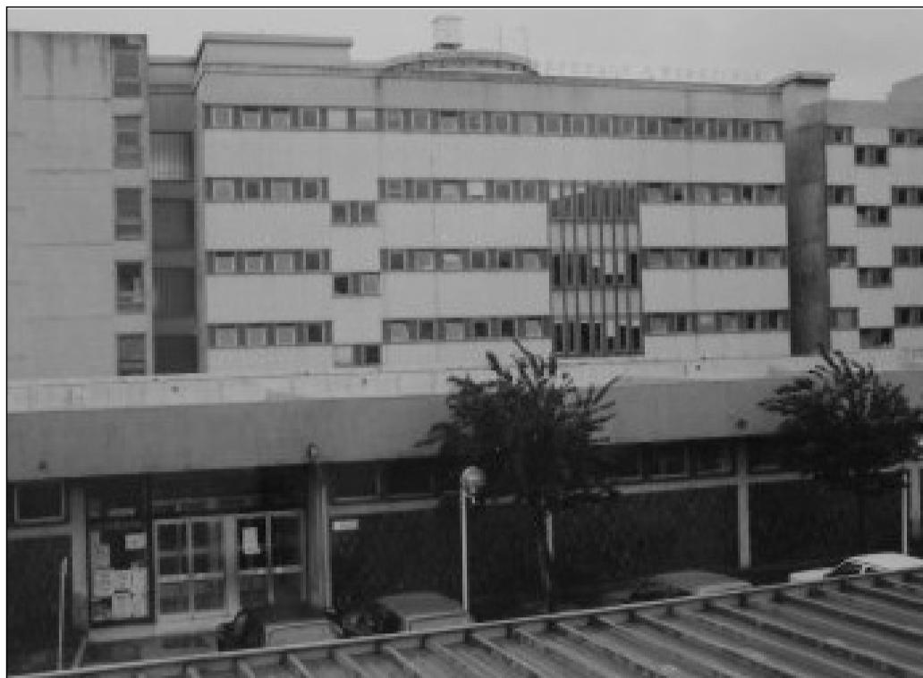
L'ospedale Veneziale di Isernia