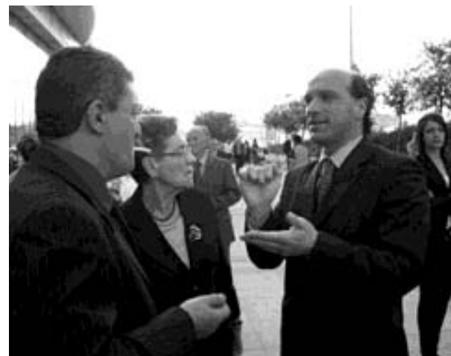
Il sindaco Cotugno potrà intervenire in Consiglio provinciale