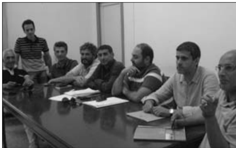
La conferenza stampa del centrosinistra di ieri