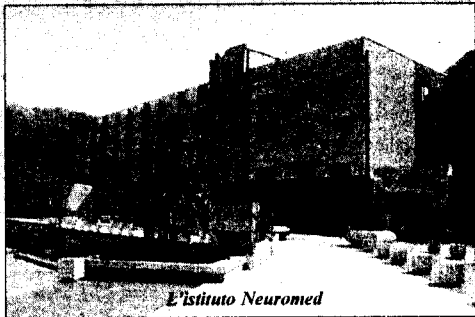
E' Istituto Neuromed