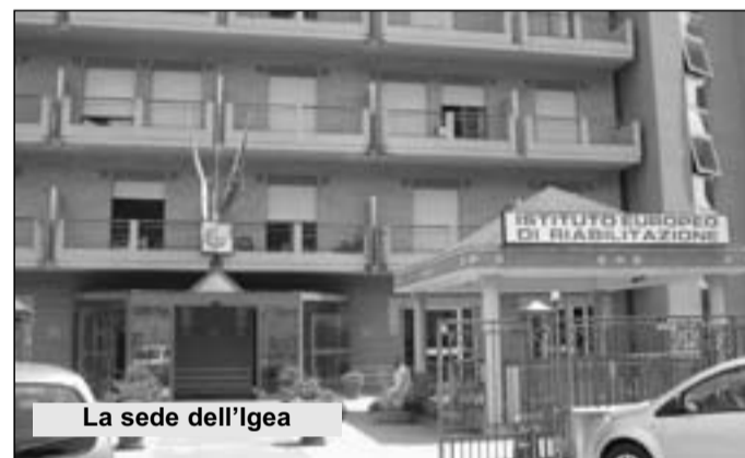
La sede dell'Igea

dati? La domanda corre di bocca in bocca tra i dipendenti, ormai stremati per una situazione che va avanti da tempo: "Non sappiamo più a chi chiedere aiuto. I politici, soprattutto dopo la fine della campagna elettorale, si sono dimenticati di noi. E' come se non esistessimo - dicono i lavoratori -. Eppure siamo 50 persone (e di conseguenza 50 famiglie) che stanno per finire sul lastrico nell'indifferenza generale. Questa struttura è andata avanti nel corso del tempo per l'abnegazione di noi lavoratori che, benché non ricevessimo lo stipendio, abbiamo continuato a fornire le prestazioni necessarie. Adesso ci ritroviamo senza lavoro