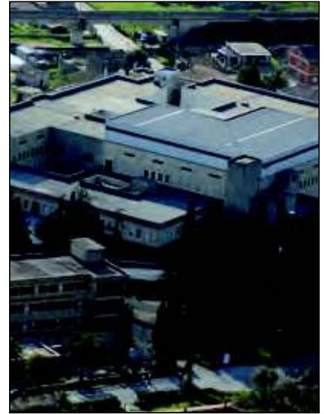
Nella foto l'ospedale visto dall'alto

Il movimento Regionale Guerriero Sannita , sempre solidale con i cittadini che lottano per i propri diritti , ha seguito e sostenuto con forza le iniziative messe in atto dai comitati sorti a dife-