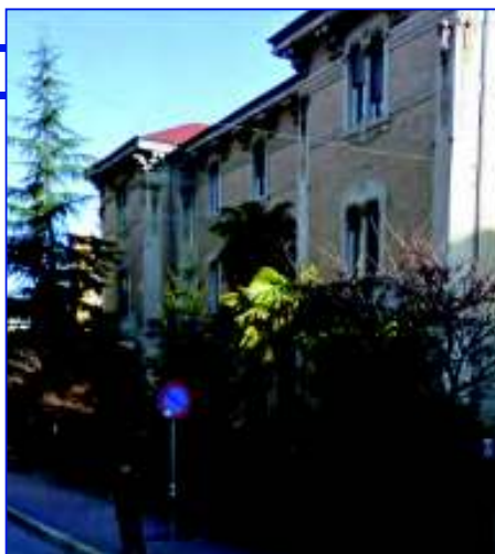
L'ingresso della casa di cura "Villa Maria", a Campobasso

"Villa Maria - spiega Iannandrea - rappresenta un punto di riferimento sanitario importante per la regione Molise e non solo. In seguito al piano di rientro, ovvero all'accordo interregionale tra Molise e Campania, c'è stata una riduzione del 30% dei compensi derivanti dai pazienti fuori regione, con conseguente sofferenza per le