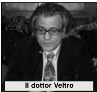
Il dottor Veltro

C.da Colle delle Api - 86100 Campobasso - Tel. 0874 618827 - 483400 - 628249 - Fax 0874 484626 - E-mail: campobasso@primopianomolise.it