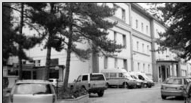
L'ospedale di Agnone