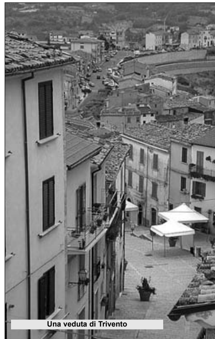
Una veduta di Trivento

Dovrebbe anche garantire nuovi posti di lavoro