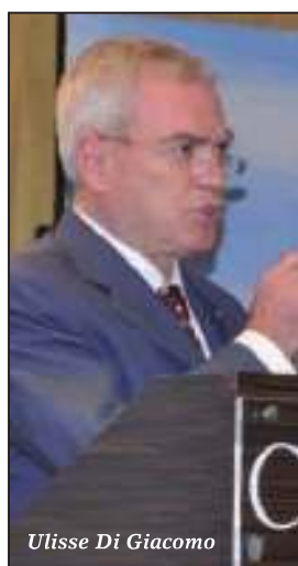
Ulisse Di Giacomo

Il Molise esempio nazionale di Sanità efficiente: lo sostiene il senatore Ulisse Di Giacomo, evidenziando che l'indagine conoscitiva della Commissione parlamentare sugli errori sanitari non ha rilevato nel periodo preso in esame (intercorso dalla fine di aprile 2009 alla metà di settembre 2010) casi di malasanità nella nostra regione. Un risultato che smentisce "luoghi comuni", ancor più prezioso non solo viste le grandi difficoltà del settore, ma soprattutto "a fronte delle critiche gratuite, malevoli e strumentali": "Ne viene fuori quindi - sostiene Di Giacomo in un comunicato - un'immagine del Molise da portare ad esempio a livello nazionale, per la sua organizzazione sanitaria e per l'alto livello di professionalità che da sempre caratterizza i nostri operatori della sanità, pur in una condizione di obiettiva difficoltà.