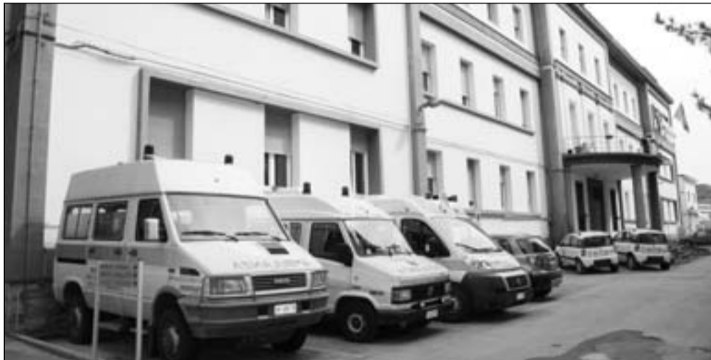
L'ospedale Caracciolo potrebbe trasformarsi in una struttura privata

"Da indiscrezioni trapelate negli ultimi giorni -afferma Zarlenga- pare che ci sia una cordata di imprenditori che sta valutando la possibi-