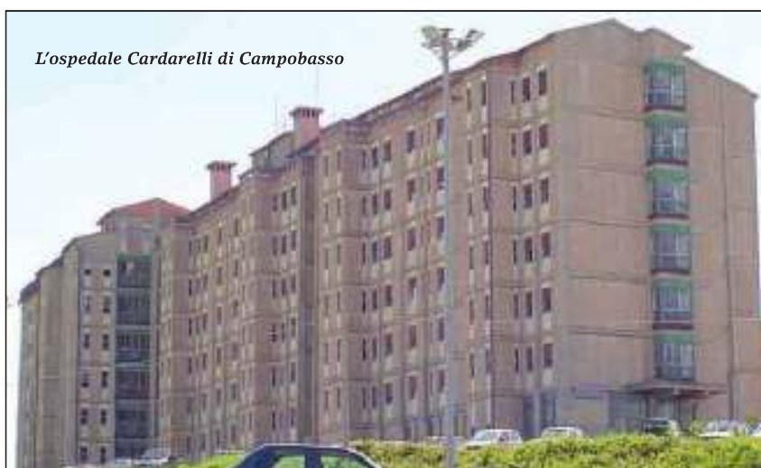
L'ospedale Cardarelli di Campobasso

Il Molise esempio nazionale di Sanità efficiente: lo sostiene il senatore Ulisse Di Giacomo, evidenziando che l'indagine conoscitiva della Commissione parlamentare sugli errori sanitari non ha rilevato nel periodo preso in esame (intercorso dalla fine di aprile 2009 alla metà di settembre 2010) casi di malasanità nella nostra regione. Un risultato che smentisce "luoghi comuni", ancor più prezioso non solo viste le grandi difficoltà del settore, ma soprattutto "a fronte delle critiche gratuite, malevoli e strumentali": "Ne viene fuori quindi - sostiene Di Giacomo in un comunicato - un'immagine del Molise da portare ad esempio a livello nazionale, per la sua organizzazione sanitaria e per l'alto livello di professionalità che da sempre caratterizza i nostri operatori della sanità, pur in una condizione di obiettiva difficoltà.