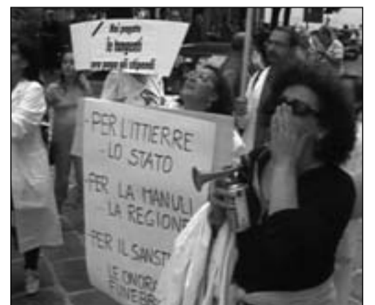
Una manifestazione dei lavoratori San Stefar

l'entrata in vigore del federalismo fiscale non lascia intravedere nulla di confortante. Per questa ragione, - chiude Petrarola - torno a sollecitare la predisposizione e la consegna di una bozza scritta sul riordino in itinere, prima che lo stesso sia consegnato al Governo, onde evitare che la seduta consiliare del 30 aprile discuta in astratto in modo generico ed inconcludente".