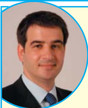
A pagina 3