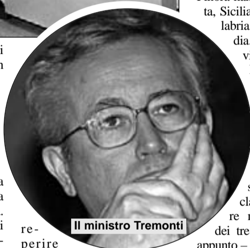
Il ministro Tremonti

È in vigore da due giorni la parte dispositiva della manovra Tremonti, quella che ha affetto immediatamente, e con essa la reintroduzione del ticket per la diagnostica e la specialistica. Se la Regione volesse evitare di far pagare dieci euro ai suoi cittadini per ogni Tac o visita dall'otorino non potrebbe perché per le regioni sottoposte a piano di rientro sarebbe impossibile