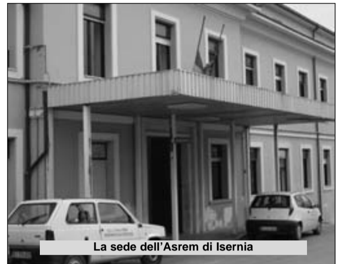
La sede dell'Asrem di Isernia