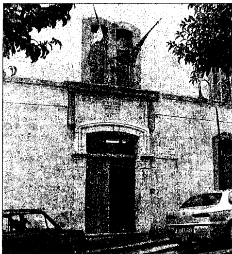
L'Istituto Comprensivo 'Colozza' di Frosolone