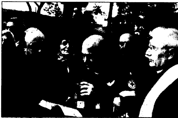
Un momento dell'inaugurazione