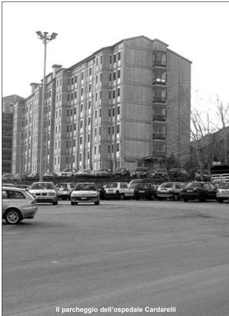
Il parcheggio dell'ospedale Cardarelli

Numerose le denunce dei visitatori, qualcuno ha perfino paura