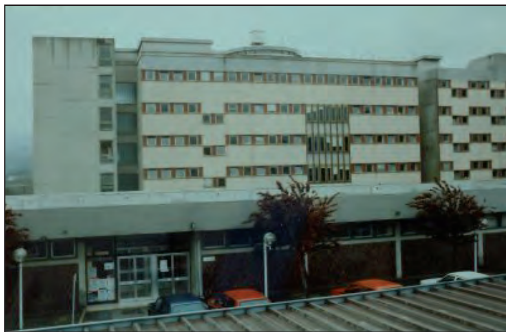
Nella foto sopra l'ospedale Veneziale di Isernia a lato il nosocomio di Venafro

Ma analoghi casi sono diventati la norma. Perché Isernia non riesce a far fronte alle troppe aumentate emergenze. Tanto che alcuni malati, anche venafrani, finiscono ricoverati ad oltre 200 chilometri di distanza. Rischiando la pelle. Eppure basterebbe organizzare meglio l'emergenza del SS Rosario di Venafro, per alleggerire il lavoro. Assistendo meglio i malati e persino risparmiando fior di milioni. Inoltre si consentirebbe ad Ortopedia del SS Rosario di