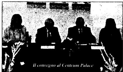
Il convegno al Centrum Palace

presenti in regione (sono sette). Si è ipotizzata la previsione di sistemi di produzione diversificati attraverso i punti di primo intervento, i presidi territoriali di assistenza, in modo tale che, con la regia del distretto, l'assistito si senta protetto sia dalla rete territoriale sia dalla rete ospedaliera".