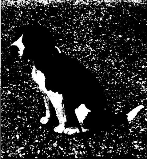
Cani, corre l'obbligo di micrichip

Un modo per tutelare la comunità, ma anche un modo - sottolineano dall'associazione - per tutelare gli animali. "Il miglior amico dell'uomo - si legge nella nota inviata alla stampa - è da sempre fonte di gioia per chi condivide con lui la propria vita. Il cane è da considerarsi un vero e proprio patrimonio affettivo per tutta l'umanità, e