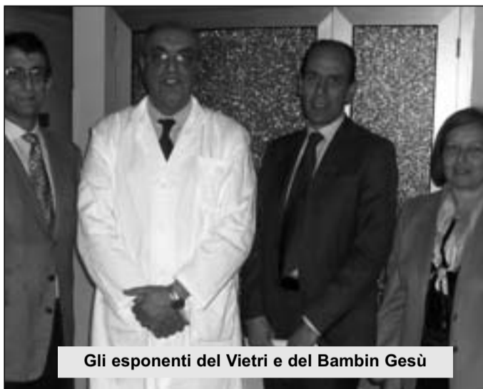
Gli esponenti del Vietri e del Bambin Gesù