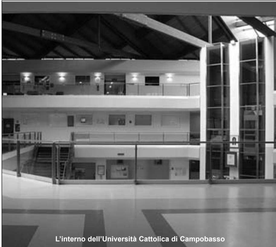
L'interno dell'Università Cattolica di Campobasso

Il Centro di Campobasso è il quinto aperto in Italia dall'Università Cattolica del Sacro Cuore. Fu Giovanni Paolo II a por-