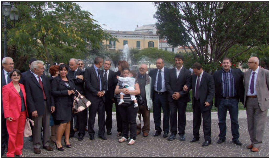
La presentazione della lista di Molise Civile ieri mattina a Campobasso