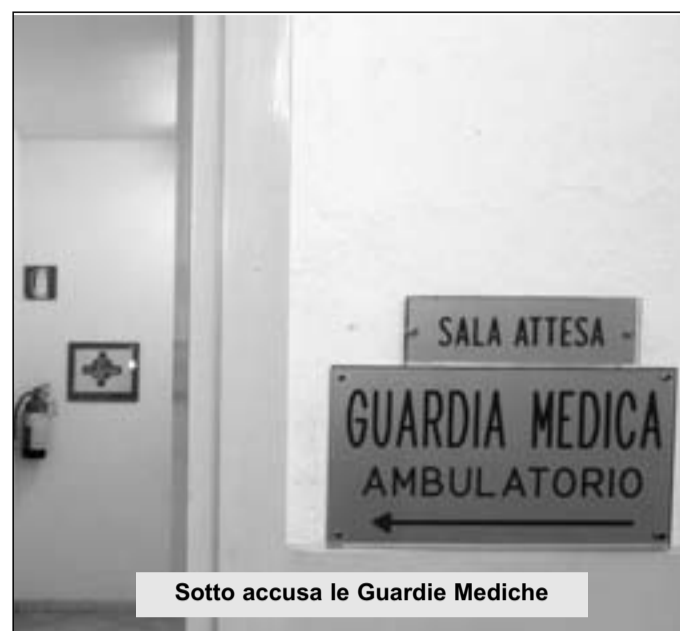
Sotto accusa le Guardie Mediche

molisana è completamente allo sfascio, molte sono le denunce di cattiva sanità con tempi di attesa troppo lunghi per qualsiasi tipo di esame e sabato un'ennesima prova di tutto questo. Un comportamento, del quale i pazienti non sono riusciti a capire se