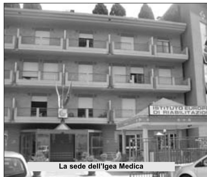
La sede dell'Igea Medica

poteva anticipare le somme che poi la Regione restituirà, allora perché ha deciso di tentare questa strada? Perché, visto che continua a dire di voler licenziare, non ha deciso di snellire il personale? Ci sentiamo sempre con la spada di Damocle dei licenziamenti sulla testa. E, ovviamente, senza stipendio" hanno spiegato i cinquanta lavoratori dell'azienda. La protesta è dietro l'angolo, quindi. "Protestare è legittimo e bisogna fare di tutto affinché i lavoratori