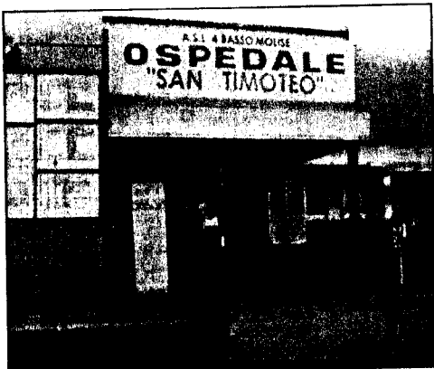
L'ospedale San Timoteo di Termoli centro di riferimento per la terapia

Sempre nel Presidio Ospedaliero di Termoli, è presente, il "Laboratorio Aritmologico" dove vengono garantite la terapia delle "sincopi cardiologiche" mediante impianto di "pace maker", la prevenzione della "Morte Improvvisa Cardiologia" mediante impianto di "Defibrillatori Intracardiaci" e la terapia inerente lo "scompenso