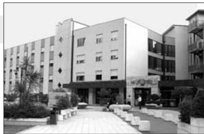
La sede del Neuromed a Pozzilli

spesa per i conti pubblici – sottolineano i legali – perché queste prestazioni magari in Lombardia costano di più, senza contare il disagio per i malati di spostarsi lontano da casa e dagli affetti in un momento difficilissimo della loro vita”. Prestazioni di altissimo livello, dunque, una struttura all'avanguardia, progetti di ricerca che portano il personale fino in Cina e un numero di