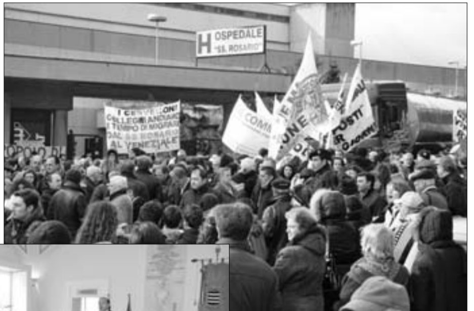
Una precedente manifestazione