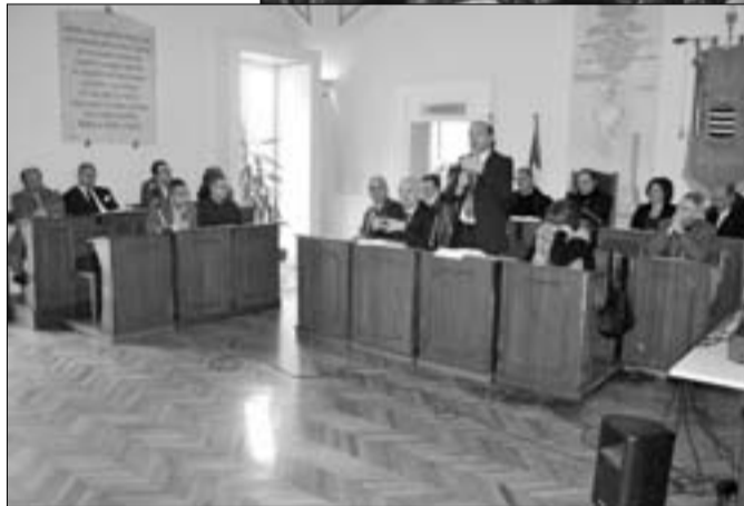
Il Consiglio si riunisce il 9 settembre