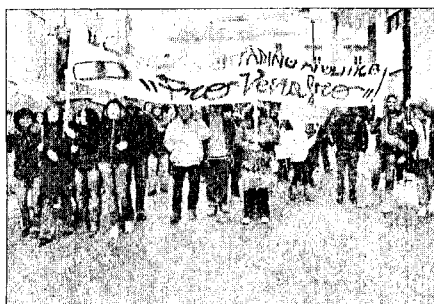
Lo striscione del comitato alla manifestazione pro ospedale

VENAFRO. Dal Comitato Consiglio Comunale del 16 "Pro Venafro" riceviamo, e febbraio scorso è emerso integralmente pubbliciamo, la seguente nota: "Dal dell'Assise Civica hanno