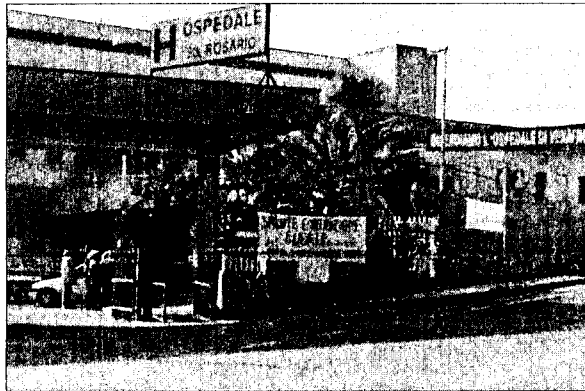
Resta alta la guardia al "Santissimo Rosario"

VENAFRO. Ore decisive per il "Santissimo Rosario". Il tempo stringe e le riunioni si susseguono a ritmo serrato, nel tentativo di salvare l'ospedale di Venafro. Un passo importante sembra essere stato compiuto lunedì scorso, in Consiglio comunale, quando maggioranza e minoranza hanno finalmente deciso di unire le forze, votando una mozione congiunta che impegna il sindaco e la giunta a farsi carico di promuovere la mobilitazione in difesa del nosocomio cittadino, e la specifica commissione consigliare a chiedere alla Regione di intervenire, se necessario, tagliando non le strutture pubbliche ma quelle private. Intanto la maggioranza facente riferimento al sindaco Nicandro Cotugno si riorganizza e fa quadrato. Dopo la riunione dell'altra sera con il presidente Michele Iorio, a Campobasso, ieri mattina sindaco, assessori e consiglieri sono tornati in conclave. "Stiamo battendo ogni possibile strada - queste le affermazio-