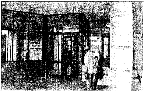
L'ingresso del Santissimo Rosario

"Non sentiamo manco il bisogno di riunirci - ci dichiara un membro del Comitato - perché ora attendiamo solo l'evoluzio-