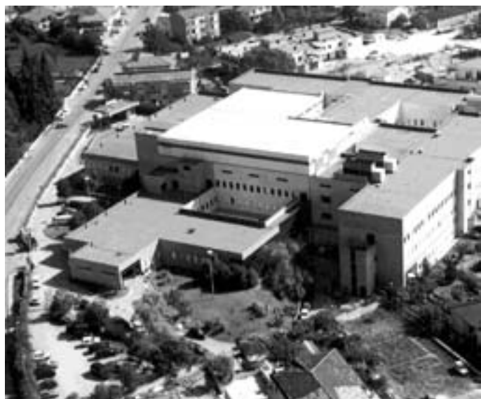
Il Ss Rosario, la gente di Venafro sabato tornerà in piazza

Per dare più forza e più voce alla partecipazione dei nostri amministratori. Il Consiglio dell'altra sera dopo aver votato all'unanimità un documento di rilancio dell'ospedale, da sottoporre ai vertici politici regionali (con in testa il governatore Iorio) ed alla Asrem, ha deciso questa forte convocazione, da tenere in mezzo alle strade cittadine. Intanto il Comitato «SS Rosario» nell'annunciare questa grande manifestazione di popolo ha affisso un pubblico manifesto, nel quale si sottolinea la gravità del momento e si invita tutta la città a dar man forte al