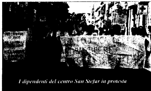
I dipendenti del centro SanStefar in protesta