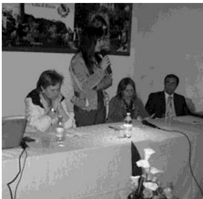
I relatori intervenuti a Riccia

RICCIA - Informazione e prevenzione. Questi i temi principali affrontati nell'incontro - dibattito dedicato alla prevenzione del tumore al seno e organizzato nella sala dell'ex convento in piazza Umberto I a Riccia dall'Università Cattolica del Sacro Cuore - Centro Integrato di Senologia con il patrocinio del Comune di Riccia.