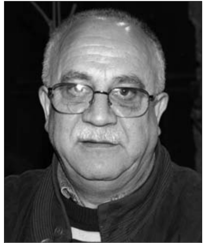
Orazio La Rocca ha scritto a Silvio Berlusconi

priamo benissimo quali gravi problemi attagliano la sanità del nostro Paese, ma questo non deve essere un motivo per recidere senza ragion veduta qualsiasi struttura sanitaria al solo fine di far risparmio. Ci sono situazioni che vanno ponderate ed analizzate e questa è una di quelle. Signor Presidente del Consiglio, il popolo molisano che l’ha scelta quale proprio rappresentante politico, in virtù della Sua storia di grande imprenditore e di uomo di larghe vedute, straordinariamente caritatevole quando c’è da affrontare problemi che toccano da vicino la gente, si rivolge a Lei affinché possa, anche in questa circostanza, dare il Suo prezioso contributo alla risoluzione del problema. In attesa di un benevolo accoglimento del presente appello questo comitato Comitato Civico porge i più sinceri e cordiali saluti”.