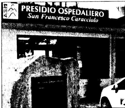
L'ospedale di Agnone

Da parte del Comitato Civico, però, queste controdeduzioni non scalfiscono l'ottimismo, in quanto i termini ultimi per l'istruttoria e la trasmissione del ricorso stesso al Consiglio di Stato, quindi per le controdeduzioni, scadevano a norma di legge lo scorso 14 agosto: mentre, oltre al fatto che la nota della Regione Molise è del 28 agosto 2011 (ben 14 giorni dopo