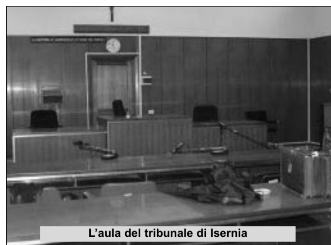
L'aula del tribunale di Isernia

gettare ancora più nello sconforto i genitori, appesi alla speranza di sapere, prima o poi, cosa sia successo a quel bambino. Non solo. Ad essere bloccata è anche l'intera indagine della procura di Isernia, aperta subito dopo l'esposto denuncia reso alla polizia dal padre del piccolo. Al momento risultano iscritti nel registro degli indagati i sanitari presenti in reparto al momento del parto della donna. Le risposte fornite dall'autopsia, però, sono fondamentali: capire quando è morto il bambino può attribuire responsabilità ai singoli