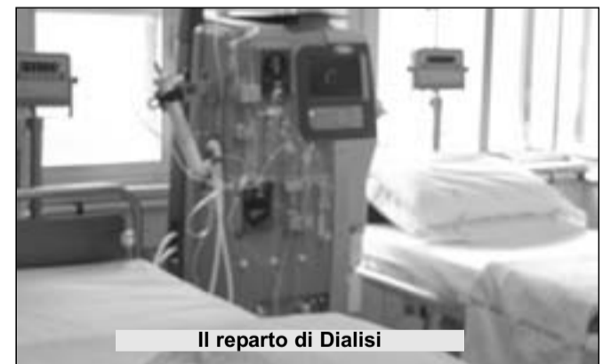
Il reparto di Dialisi

AGNONE. Ristabilita la calma nel reparto Dialisi dell'Ospedale San Francesco Caracciolo, dove pochi giorni fa i pazienti hanno rifiutato di sottoporsi alla consueta terapia vitale, per protestare contro il blocco delle reperibilità infermieristiche. Dopo le polemiche, i vertici sanitari hanno ripristinato gli orari extra per gli infermieri fino al 31 gennaio di quest'anno. Sedando gli animi. Ma la notizia ha creato gran trambusto nel settore sanitario, anche perché il reparto dedicato alla nefrologia da tempo è sotto il mirino del malcontento, non solo per le questioni legate alla presunta mancanza di personale, ma anche per gli spazi strettissimi in cui i dializzati sono relegati (nove letti con altrettanti macchinari in un'unica stanza a cui si accede da un angusto corridoio). Così, per oggi è stata convocata una riunione tecnica dal direttore sanitario Asrem, Gianfranco Paglione, con i responsabili dei reparti Dialisi di Agnone e di Isernia, con lo scopo di discutere dei problemi del servizio all'interno del nosocomio alto molisano. Capire se sia necessario attivare servizi sostitutivi oppure prorogare le reperibilità contestate, anche oltre i termini di questo mese. Per quanto riguarda, invece, la visita dell'assessore Filoteo Di Sandro nella struttura agnonese, pare che ciò non avverrà a breve. Solo dopo che