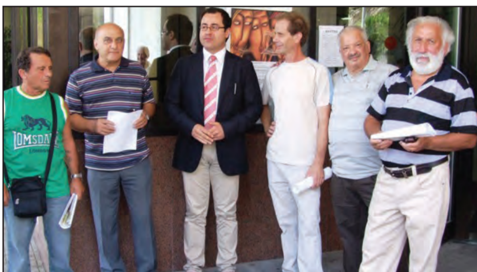
Nella foto il comitato Santissimo Rosario

VENAFRO. In attesa della discussione nel merito del ricorso "salva ospedale" e, dunque, in pieno regime di sospensiva dell'efficacia di tutte le misure varate dall'Azienda sanitaria regionale, Commissario ad acta e sub commissario volte alla razionalizzazione dell'ospedale Santissimo Rosario, il direttore generale dell'Asrem, Angelo Percopo, tenta di emanare un nuovo provvedimento. Reca la data di ieri il documento con il quale si chiede al governatore Iorio, nella sua qualità di commissario, l'autorizzazione per l'attivazione di dieci posti letto di lungodegenza presso il nosocomio di Venafro. L'Unità operativa semplice do-