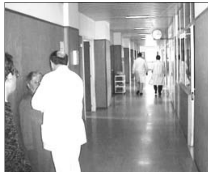
La sanità resta sempre un punto nodale per la politica

base delle indicazioni del tavolo tecnico Stato - Regione per azzerare il disavanzo e non per accrescere il deficit con un organismo politico e assembleare che non potrà produrre alcunché. Di questo otteniamo conferme anche da chi fino a ieri faceva parte di quella commissione e oggi la