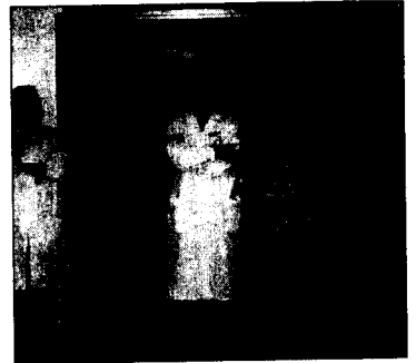
Il personale del Pronto soccorso di Isernia La foto è stata pubblicata su e-bay

approvare rapidamente il provvedimento del loro passaggio alla Dirigenza medica, strumento necessario, a dire di Crudele, per risolvere il problema. Nel contempo lo Smi ed i medici del 118 hanno deciso di affiancare tutte le ulteriori iniziative di lotta che saranno intraprese dai colleghi del Pronto Soccorso. Della vicenda si sta occupando anche la stampa nazionale e probabilmente nei prossimi giorni la trasmissione Striscia la Notizia invierà a Isernia il Gabibbo. Tutto ciò grazie anche all'impiego "fantastico" delle nuove tecnologie ed in particolare di Internet, prima attraverso il video collocato su youtube e poi con l'annuncio su e-bay, nel quale il personale del pronto soccorso Isernia "esasperato e stressato da catastrofica gestione aziendale" si offriva in vendita "per condizioni di lavoro normali". Nei prossimi giorni verranno annunciate nuove iniziative pubbliche. Intanto il personale del Pronto Soccorso ha voluto con un comunicato stampa ringraziare i cittadini di Isernia "che sono intervenuti in massa nel giorno della raccolta delle firme, dimostrando con i numeri di condividere a pieno la nostra protesta". Con la