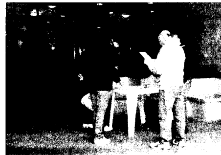
Prosegue la raccolta delle firme

Il presidente ha contattato i vertici del Comitato civico