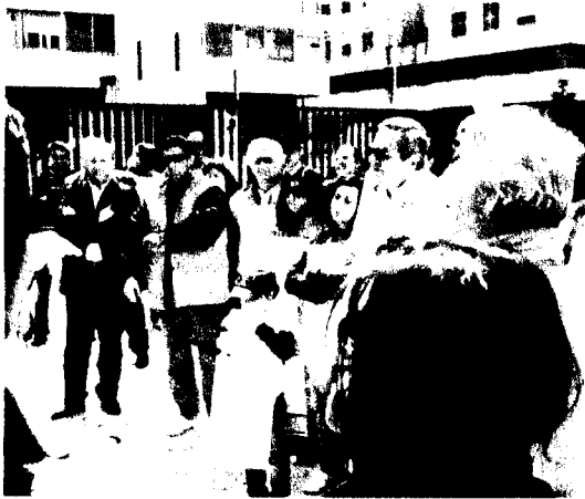
Isernia Continua la protesta dei medici

■ ISERNIA Non desistono i medici del pronto soccorso del "Veneziale" di Isernia, i quali chiedono più personale per far fronte all'aumento della mole di lavoro registratosi all'indomani della ristrutturazione della rete ospedaliera in provincia e la chiusura dell'Emergenza a Venafro. Dopo l'occupazione simbolica del reparto — lavorando col lutto al braccio — e dopo il corteo per le strade della città con sit-in conclusivo dinanzi alla Provincia, il personale ha messo in piedi una nuova e plateale forma di protesta. Di nuovo per via telematica. Di nuovo perché nei giorni scorsi su YouTube è stato pubblicato un video girato nel nuovo reparto del nosocomio cittadino in cui medici, infermieri e personale ausiliario spiegano il perché della loro protesta. Ora, come si diceva, una nuova iniziativa. Quale? Si sono messi in vendita all'asta su e-bay. E c'è anche chi ha risposto: ci sono