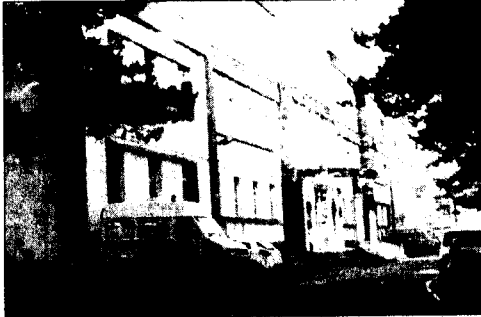
Il provvedimento sarebbe stato firmato dal direttore generale

Nessun taglio all'ospedale di Agnone, i posti letto restano invariati. Buone notizie, dunque, per il presidio ospedaliero altomolisano, notizie che giungono direttamente dai vertici dell'Asrem che, attraverso un provvedimento datato il 9 aprile scorso, avrebbero reso operativo il piano di riassetto della rete sanitaria della regione. Il provvedimento (il numero 566) sarebbe già stato inviato ai responsabili delle zone territoriali affinché si attivino immediatamente per ridistribuire i posti letti, così come previsto dai vertici dell'Asrem regionale. Il