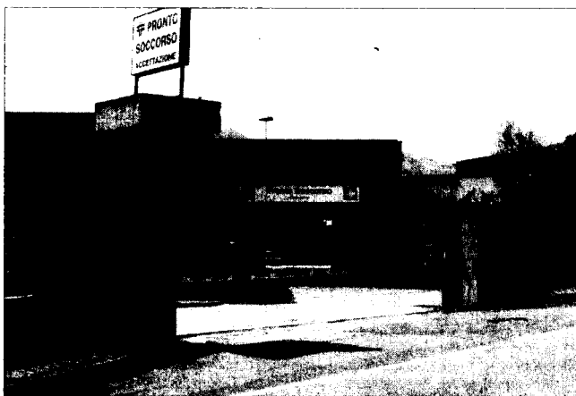
Nelle ore notturne il pronto soccorso di Venafro non è in grado di offrire assistenza

VENAFRO. "In preda a febbre altissima e violenta emicrania, nel cuore della notte ho chiesto aiuto ad un conoscente, che mi ha accompagnata al pronto soccorso del Santissimo Rosario. Mi aspettavo immediata attenzione da parte del personale presente, invece non si sono degnati nemmeno di misurarmi la febbre. Un dottore, o forse un infermiere, si è limitato a consigliarmi di recarmi ad Isernia, dove avrei trovato personale adatto ad affrontare il mio problema". Queste le preoccupanti dichiarazioni di una giovane donna, di origini polacche ma residente a Venafro, che nella notte tra sabato e domenica si è recata al pronto soccorso del nosocomio venafrano in quanto afflitta da febbre a quaranta e dolori lancinanti alle tempie, forse in conseguenza di una infiammazione. La ragazza, che presentava anche una perdita di sangue dall'orecchio sinistro, si è così vista costretta a recarsi ad Isernia. "I sanitari del Ferdinando Venezia si sono subito resi conto della gravità delle mie condizioni e mi hanno immediatamente sottoposta ad una accurata visita. Immediata anche le prime cure, attraverso iniezioni e antibiotici, tanto che in pochi minuti la febbre ha iniziato ad abbassarsi e le mie condizioni sono nettamente migliorate". Passata la paura, i medici in servizio al Venezia hanno chiesto alla 23enne le ragioni per cui si era recata ad Isernia e