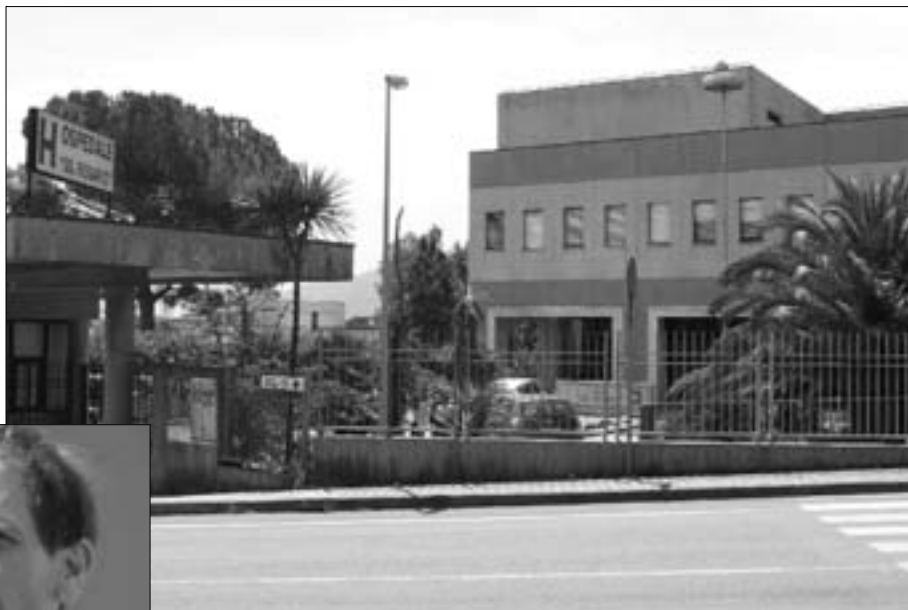
L'ospedale “Santissimo Rosario”

quelle di Vaccone, che sembrano trovare però conferma nei comunicati e nelle dichiarazioni rese negli ultimi giorni dai vertici della sanità regionali, che si dicono ormai pronti a porre in essere “i de-