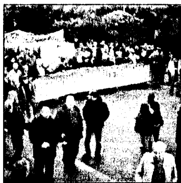
Una manifestazione in favore dell'ospedale