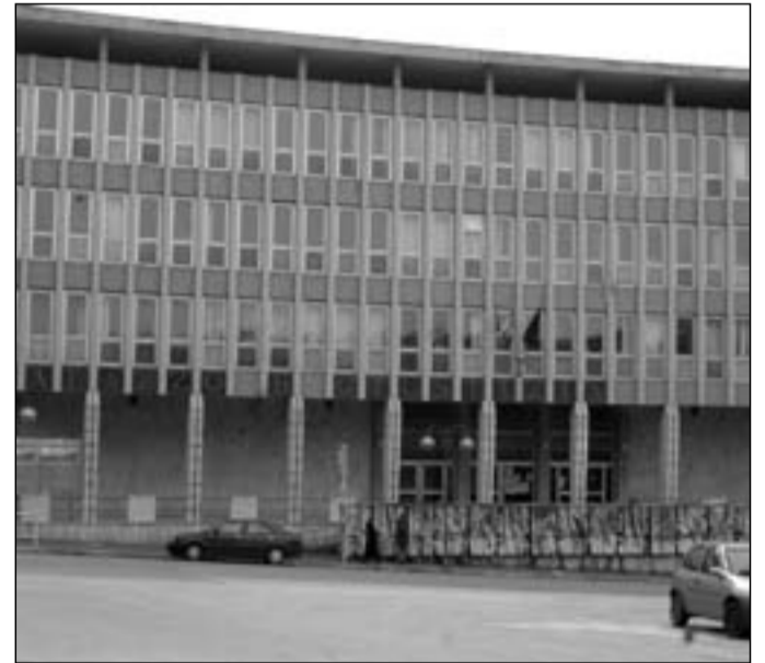
Il processo era partito dal tribunale di Isernia