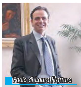
Paolo di Laura Frattura

VENAFRO. In un clima caldissimo e tra strette di mano si è consumato il tour del candidato alle Primarie del centrosinistra Paolo di Laura Frattura anche a Venafro. Il presidente di Unioncamere Molise ha percorso le vie cittadine al fianco dell'esponente locale di Alternativ@ e già consigliere regionale, Massimiliano Scarabeo, il quale ha fatto "gli onori di casa". Frattura si è presentato alla popolazione cercando di carpirne le istanze. E tra commenti circa l'attuale situazione politica e provocazioni, ha parlato dei suoi intenti: dalla riduzione della spesa pubblica al miglioramento dei trasporti. Ma soprattutto dell'occupazione, pensando ai precari e ai disoccupati. «Si tratta di una questione nodale, - ha spiegato Frattura - specie per una Regione sbilanciata