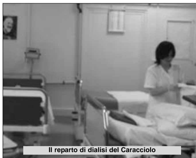
Il reparto di dialisi del Caracciolo

municato come svolgere le reperibilità. Percopo forse non è ben al corrente di tutta la faccenda. Forse non ha capito che ad Agnone il nuovo nefrologo non arriverà." Oppure è solo un ectoplasma.