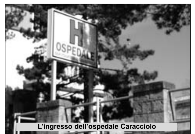
L'ingresso dell'ospedale Caracciolo

Come dimostra anche la vicenda del reparto Dialisi. Entro questa settimana, ad ogni modo, dovrebbe esserci una nuova tavola rotonda tra gli amministratori comunali, i responsabili sanitari, referenti dell'Asrem, della Chiesa locale e i comitati civici. Avranno in questa occasione la possibilità di considerare il recente documento? Su quali richieste, nello specifico, si punterà per la salvezza del Caracciolo? Qualcuno ipotizza la sperimentazione pubblico - privata temporanea (con almeno una quota pari al 51% pubblica). Qualcun altro, come il sindaco Carosella e l'intera amministrazione, crede che sia necessaria un'azione comune di tutti i primi cittadini del territorio alto molisano. Infine, restano due quesiti a cui, tergiversando, nessuno riesce a dare una risposta. Come adeguarsi alle direttive dettate dall'ordinanza del Tribunale Amministrativo Regionale? E cosa farà il nuovo commissario Morlacco? Quest'ultimo, che molti danno già come pseudo sostituto del commissario ad acta M. Iorio, proprio ieri avrebbe parlato della necessità di almeno due anni per sistemare la situazione sanitaria molisana. Ma il tempo corre, e ad Agnone si ha la sensazione che sia indispensabile trovare una soluzione in fretta. Prima che succeda l'inevitabile.