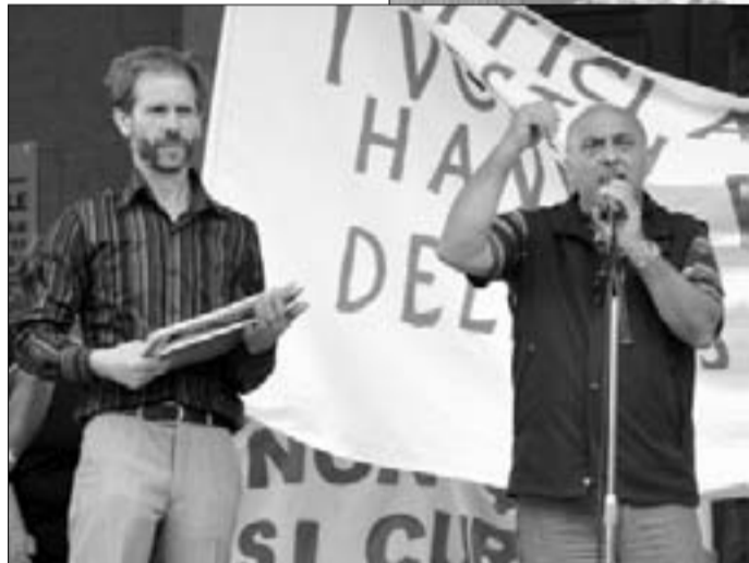
Tanti gli striscioni esposti durante la manifestazione

rato. Il popolo, anche se ridimensionato, vuole la sicurezza totale anche come pronto intervento. Se ciò non è possibile vuol dire che siamo tornati indietro nel tempo, al periodo in cui il popolo non era sovrano ma schiavo di persone che con la politica senza rischiare, un pò come fanno i mafiosi, dominano il mondo. Se fosse così - è la ‘minaccia’ di Vaccone -, in prima persona io e tutti gli altri che mi hanno dato fin qui fiducia attraverso la loro presenza e le loro firme occuperemo il Comune per fare in modo di mandare via i re-