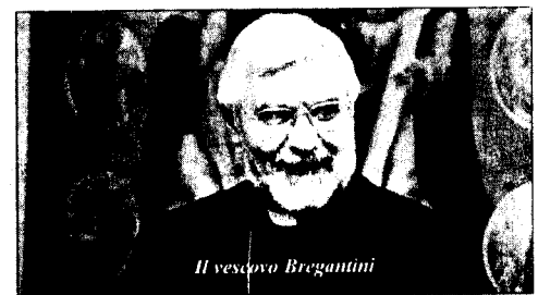
Il vescovo Bregantini

effettive necessità finanziarie del Centro della Cattolica nell'ottica dell'integrazione con altri presidi sanitari del territorio".