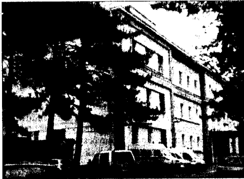
L'ospedale San Francesco Caracciolo

destino di un territorio che non deve delegare le scelte ed il futuro ad altri. Necessità essere propositivi. Chiedere e pretendere garanzie di assistenza minime sulle quali non si deve e non si può derogare. Irrilevanti saranno gli strumenti utilizzabili. Poco