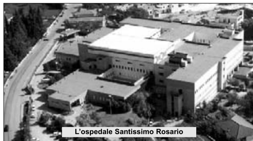
L’ospedale Santissimo Rosario

unica tra quelle esistenti - l’Unità operativa complessa di Pronto Soccorso del “Ss. Rosario”. Oggi è un punto di primo soccorso che gestisce solo i cosiddetti “codici bianchi” e “codici verdi”. Le urgenze e le situazioni complicate vengono dirottate altrove e spesso i pazienti che vengono prelevati dall’ambulanza del 118 si ritrovano fuori regione: in Campania, in Puglia, in Abruzzo. Soppresse anche altre Uoc: Radiologia, Riabilitazione, Laboratorio Analisi, Chirurgia, Dialisi e, di fatto, anche Medicina. I 4 posti di chirurgia previsti dall’atto aziendale non sono mai stati attivati. Come i due posti tecnici di terapia intensiva, che non esistono. I tagli non hanno risparmiato nemmeno la Dialisi, Uos a valenza dipartimentale. Manca il personale e non ci sono nemmeno i letti antidecubito. Il reparto di Ortopedia, che secondo le promesse di Iorio e compagnia doveva essere il ‘polo di eccellenza’, opera in un contesto di precarietà generale per l’insufficienza di per-