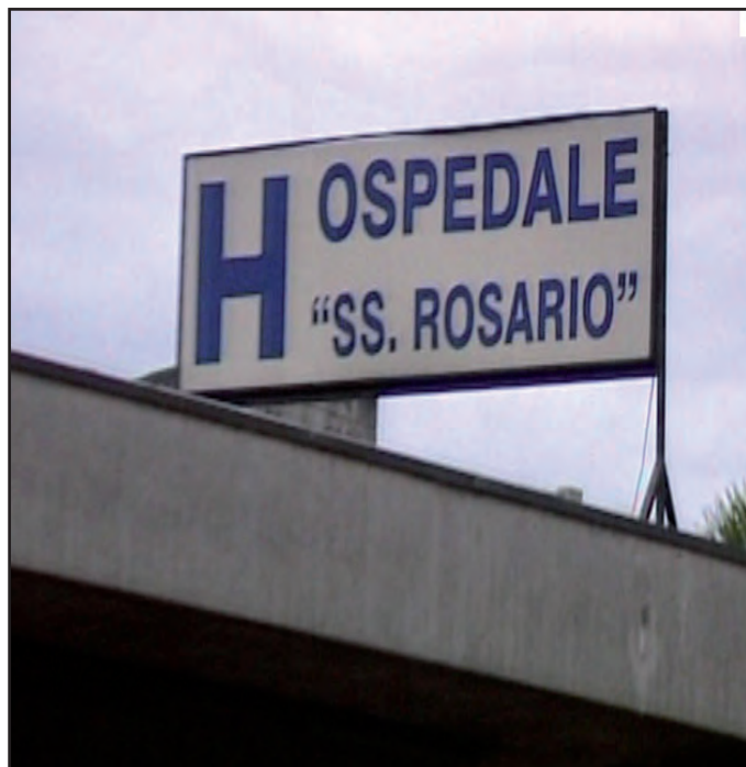
Nella foto l'ospedale di Venafro

Questi fatti sono drammatici e dimostrano che la politica dei tagli indiscriminati nella sanità produce disservizi e disagi, mette in pericolo la vita delle persone e le priva del loro sacrosanto diritto alla salute