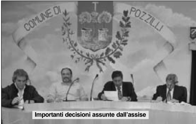
Importanti decisioni assunte dall'assise

Transazione sugli oneri di urbanizzazione e ampliamento della struttura: doppio sì dell'amministrazione