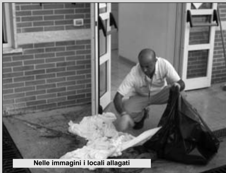
Nelle immagini i locali allagati