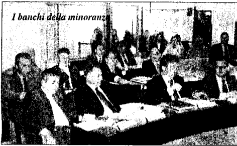
I banchi della minoranza