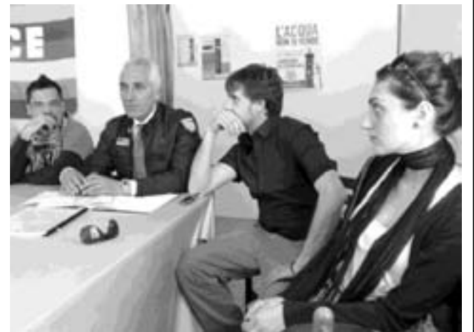
La conferenza stampa nella sede di via Fratelli Brigida 101

Riunione senza la presenza delle associazioni cittadine