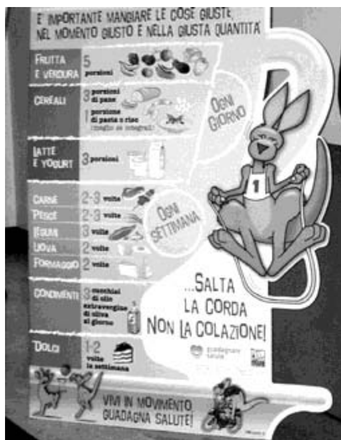
Il totem Canguro SaltalaCorda esposto nelle scuole

Anche l'attività fisica, nella nostra regione, dai risultati dell'indagine, sembra non avere la sua giusta collocazione. Molta televisione e videogiochi e poca attività fisica sia a scuola che a casa. La metà dei bambini, infatti, possiede un televisore in camera propria e solo un bambino su 10 svolge il livello di attività fisica raccomandato per la sua età. La percezione del problema da parte dei genitori sembra inversamente proporzionale alla frequenza statistica del peso in eccesso: quattro mamme su dieci di bimbi in sovrappeso non ritengono